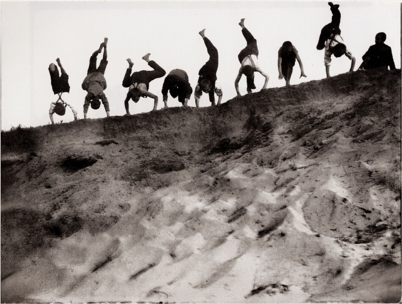
Anonym: »Kinder und Kinderspielplätze, acht Jungen üben Handstand« um 1900 (?), 9,0 x 12,0 cm, [aus: Heinrich Zille: Werke und Schriften. DVD, directmedia Verlag, Berlin 2007, S. 1592].

Den Beginn der fotografischen Tätigkeit von Zille legt Kaufhold auf 1882 fest. 25 In diesem Jahr kam der Soldat Zille in seine vorherige Arbeitsstätte zu Besuch, und dort soll er die Fototechnik für zwei Selbstbildnisse, die im Werkverzeichnis unter Nr. 1 und Nr. 2 gelistet sind, genutzt haben. Entgegen sämtlichen gesellschaftlichen Zwängen und Gepflogenheiten – so die offensichtliche Deutung von Kaufhold – ist Zille der Macher. Nicht nur diese Auslegung muss hinterfragt werden, auch die räumliche Zuordnung ist zweifelhaft. Denn allein anhand der auf dem Foto abgebildeten Fußbodendielen will Kaufhold einen Zusammenhang mit einem 10 Jahre später aufgenommenen Foto in den Räumen der Betriebsstätte am Dönhoffplatz erkannt haben. 26 Die Wand, an die sich Zille in den ersten beiden Fotos lehnt, hat keine Ähnlichkeit mit der auf dem späteren Gruppenbild. Demzufolge müssen die Fotos in verschiedene Richtungen aufgenommen worden sein. Wie aber sollen dann dieselben Dielen wiedererkannt werden können?